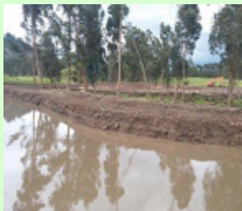
Río Teusacá - Sopo