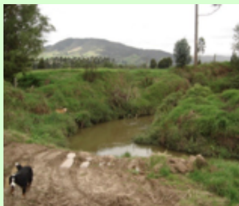
Río Teusaca - La Calera