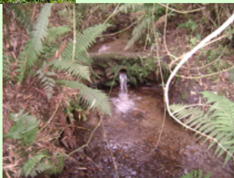
Quebrada Los Molinos - La Calera